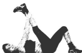
GYM CLUB PLOUDANIEL